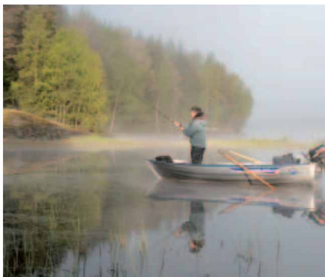
Wer die Uferbereiche intensiv mit der Spinnrute abklopft, ist in aller Regel schon bald erfolgreich.