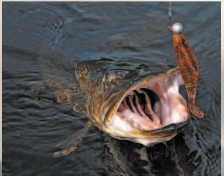
Bräunliche Gummifische zählten zu den besten Ködern für den Fang von Hechten.