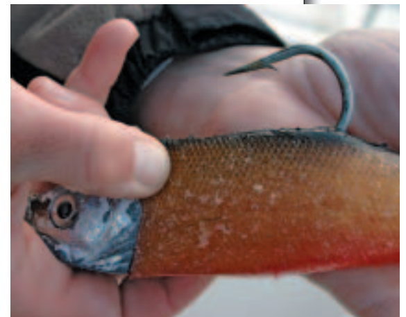
Der zerbissene Erfolgsköder: ein 23 Zentimeter langer Gummifisch von Storm.

Beste Köder sind 200 bis 400 Gramm schwere Gummifische wie die WildEye Giant Jigging Shads von Storm.