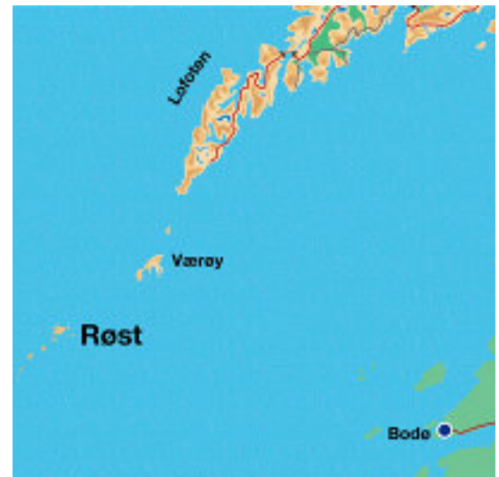
Die kleine Insel Røst liegt in Nordnorwegen, südlich der Lofotenkette.