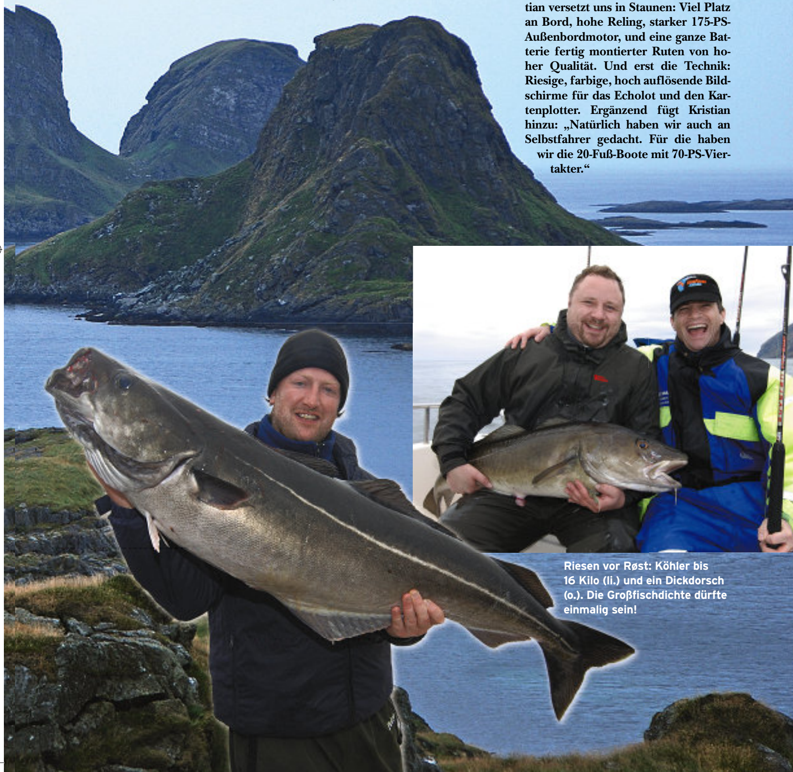
Riesen vor Røst: Köhler bis 16 Kilo (li.) und ein Dickdorsch (o.). Die Großfischdichte dürfte einmalig sein!