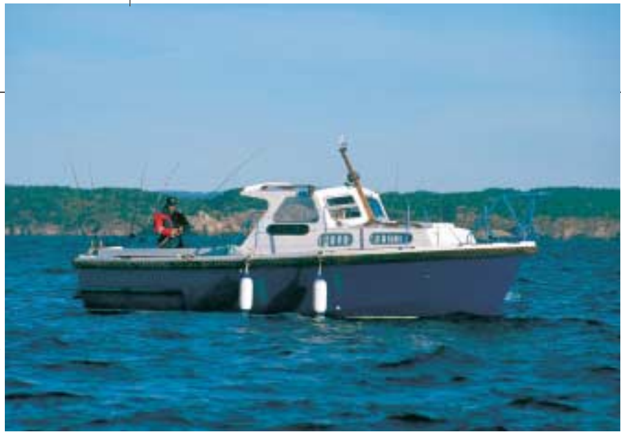
Die MS „Orlando“. Ein ideales, hochseetüchtiges Anglerboot. Gute Fänge sind vorprogrammiert.