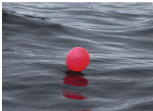
Die Makrele (oben) wird auf einen Einzelhaken am dicken Stahlvorfach gezogen. Den Biss eines Blauhais zeigt ein knalliger Luftballon an (links).

der Fisch schlägt wild um sich. Zum Glück haben wir alles aus dem Weg geräumt, wie Luke es uns aufgetragen hatte.